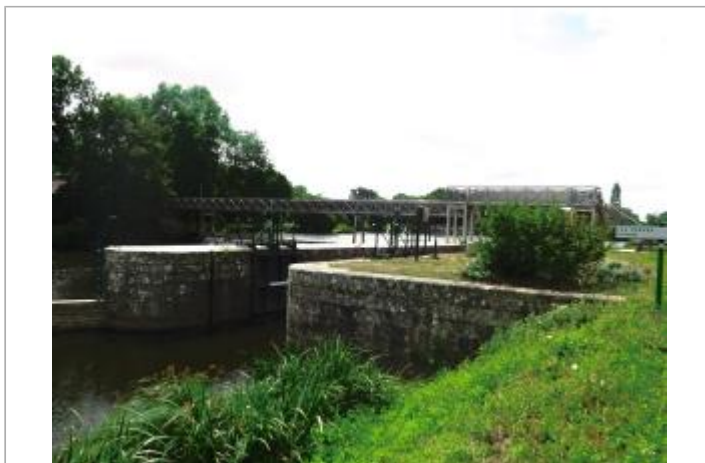
Ecluse de Rouvray échelle aval (disparue) à les Forges de Lanouée