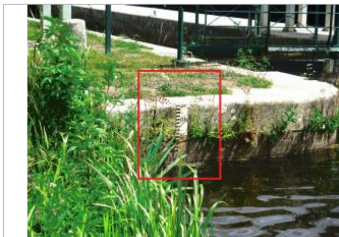
Ecluse de Rouvray échelle amont à les Forges de Lanouée