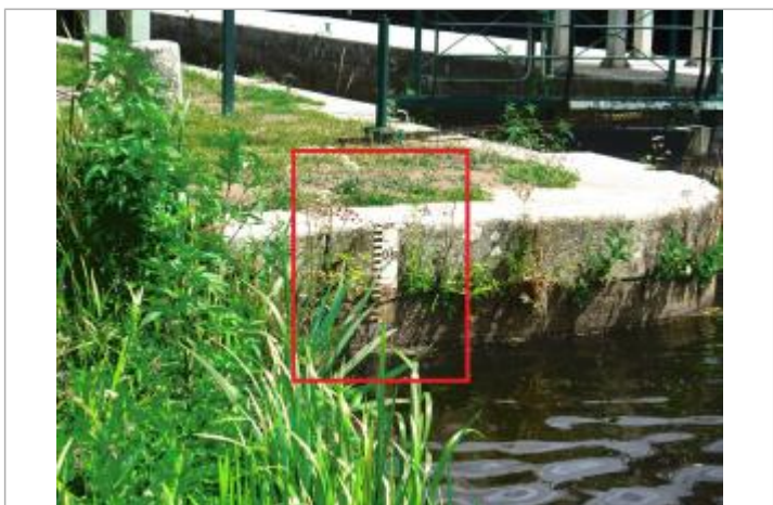
Ecluse de Rouvray échelle amont à les Forges de Lanouée

GÉNÉRAL Code : SPC_56102_05_1930 Date de mise à jour : 01/08/2023 Auteur : SPC VCB