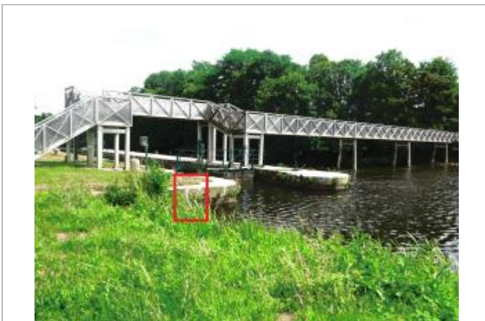
Ecluse de Rouvray amont à les Forges de Lanouée

GÉOLOCALISATION Coordonnées WGS84 : X: -2.59363517 / Y: 47.96000320 Coordonnées RGF93 (Lambert 93) : X: 282863.23 / Y: 6776960.21 Coordonnées RGF93 (ETRS89) : X: -2.5936352 / Y: 47.9600032 Code Hydro: J8--0230 Rive de référence: Gauche