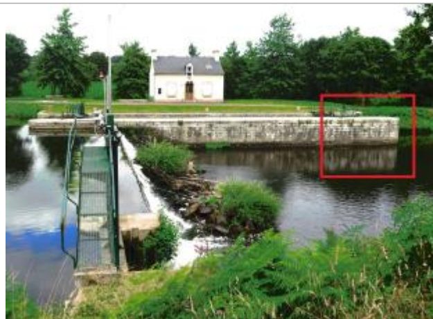
Ecluse de Bocneuf aval à les Forges de Lanouée

Coordonnées WGS84 : X: -2.61248921 / Y: 47.95781750