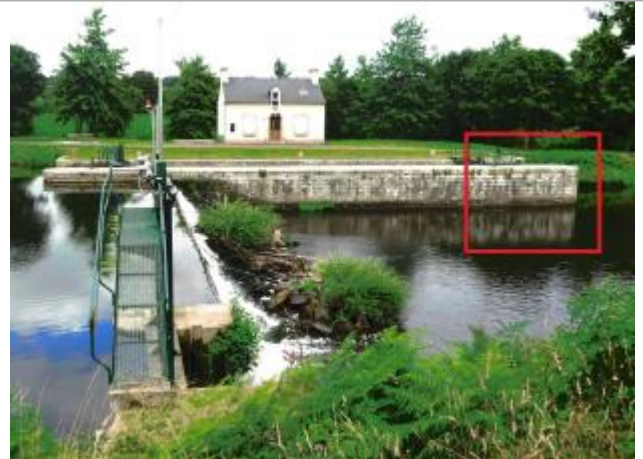
Ecluse de Bocneuf aval à les Forges de Lanouée

Coordonnées WGS84 : X: -2.61248921 / Y: 47.95781750