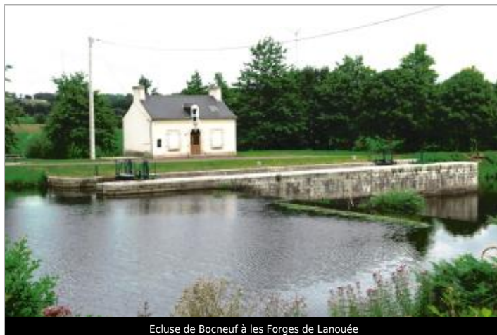
Ecluse de Bocneuf à les Forges de Lanouée