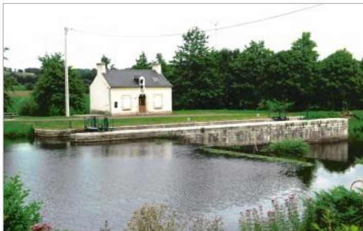
Ecluse de Bocneuf à les Forges de Lanouée

Coordonnées WGS84 : X: -2.61301636 / Y: 47.95787090