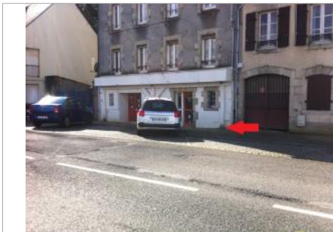
Angle du 15 Quai Brizeux