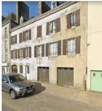
Immeuble au 14 quai Brizeux