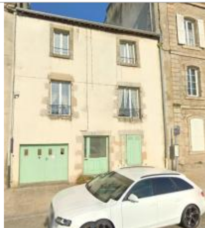
Immeuble au 13 quai Brizeux