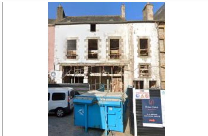
Immeuble au 4 place Hervo