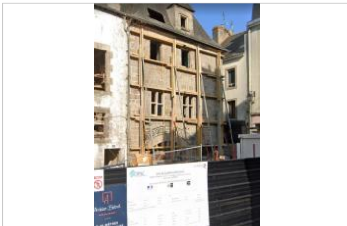
Immeuble au 5 place Hervo