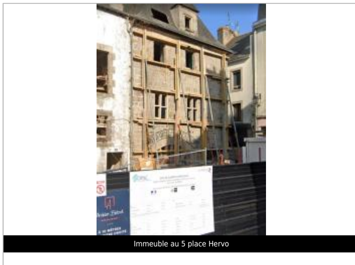
Immeuble au 5 place Hervo