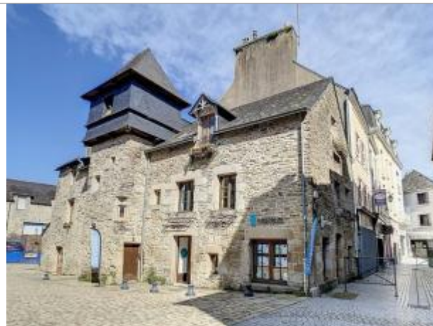
Agence immobilière au n°3 place Isole