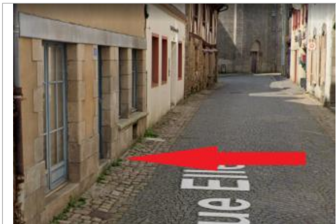
maison au n°6 rue de l'Ellé