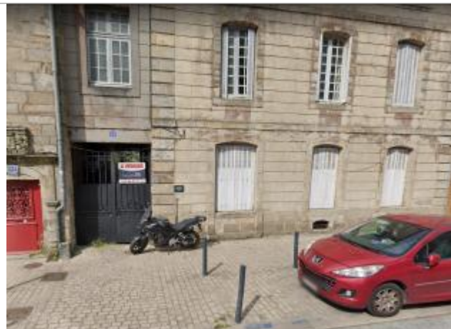
Maison au 13 rue Brémond d'Ars