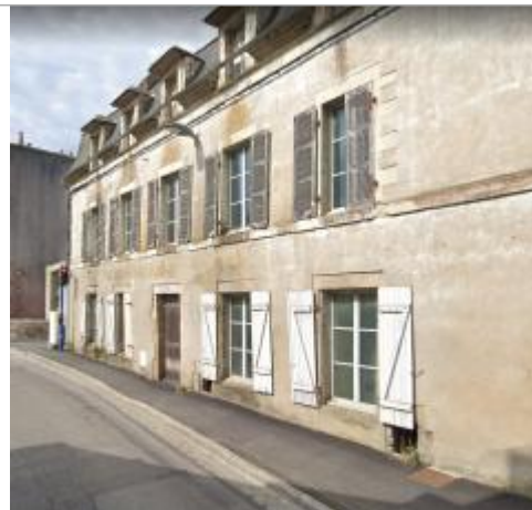
Maison au 27 rue Brémond d'Ars