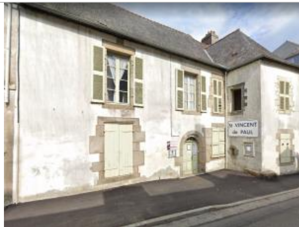
Maison au 29 rue Brémond d'Ars