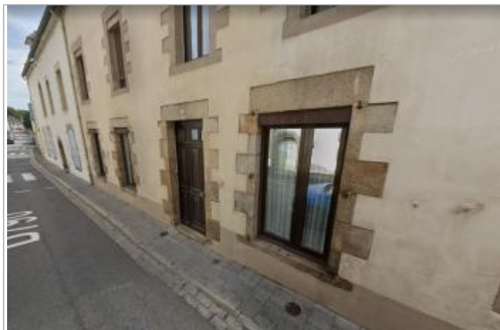
Maison au 34 rue Brémond d'Ars