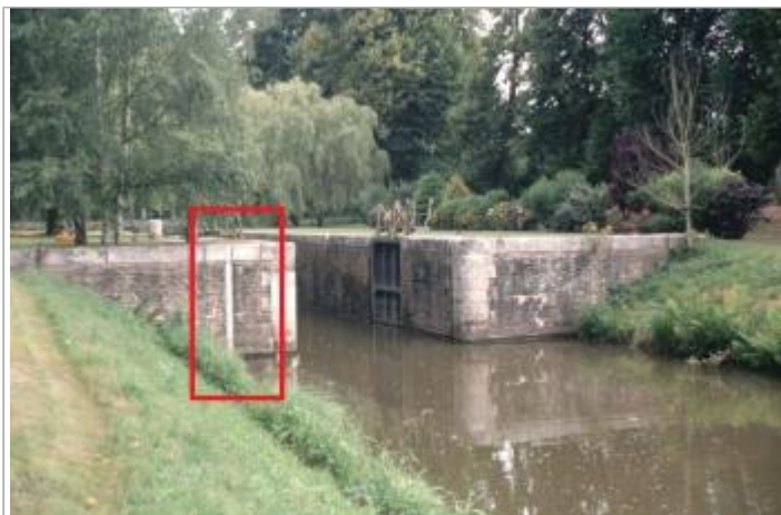
Ecluse de Pomeleuc aval à les Forges de Lanouée