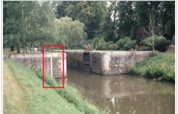
Ecluse de Pomeleuc aval à les Forges de Lanouée

Coordonnées WGS84 : X: -2.62394223 / Y: 47.97364890