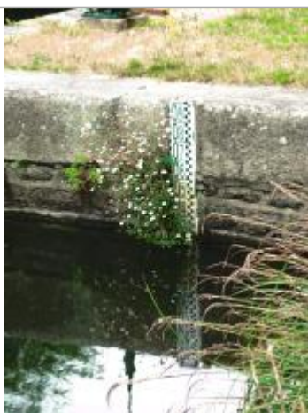
Ecluse de Cadoret à Pleugriffet échelle amont

Altitude calculée de l'eau (en m) : 45.828 m