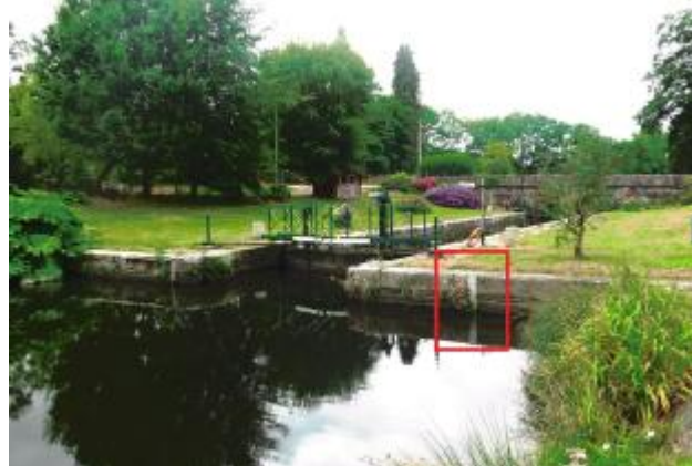
Ecluse de Cadoret amont à Pleugriffet