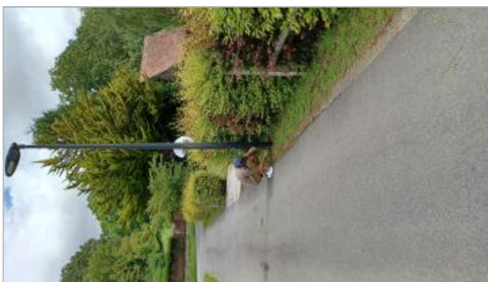
Laisse de crue sur le lampadaire

SOURCE DE REPÉRAGE : VISITE DE TERRAIN SPC SACN - 11/03/2020