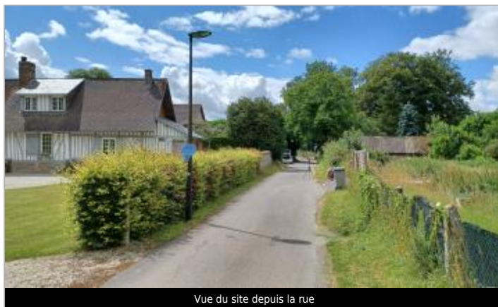
Vue du site depuis la rue