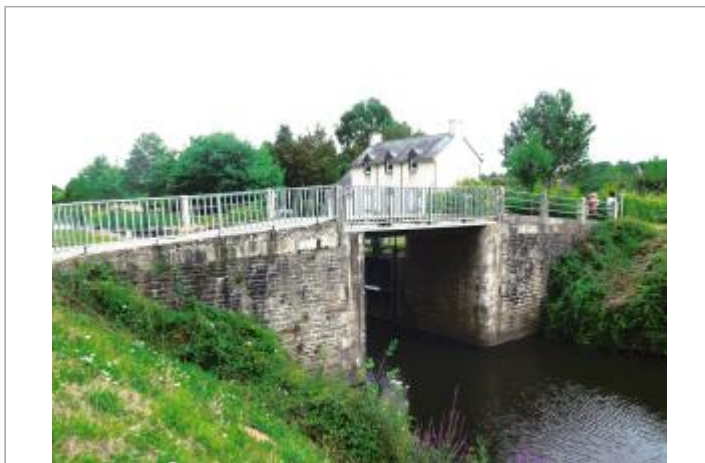
Ecluse de Griffet aval à Bréhan

Coordonnées WGS84 : X: -2.67250104 / Y: 48.01069190