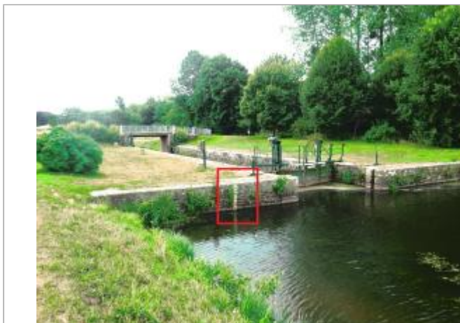
Ecluse de Griffet amont à Bréhan