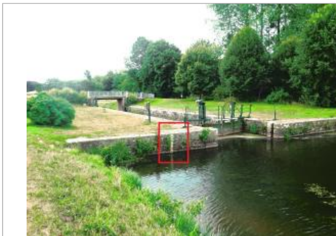
Ecluse de Griffet amont à Bréhan

Coordonnées WGS84 : X: -2.67279490 / Y: 48.01097340