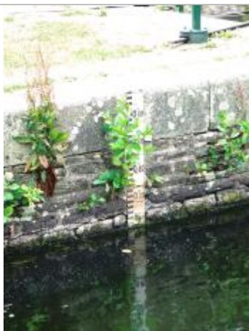
Ecluse de Griffet à Bréhan échelle amont