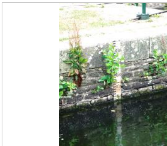
Ecluse de Griffet à Bréhan échelle amont