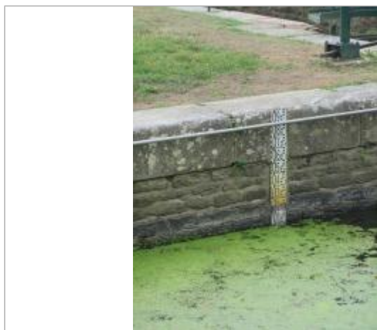
Ecluse de Grenouliere à Bréhan échelle amont