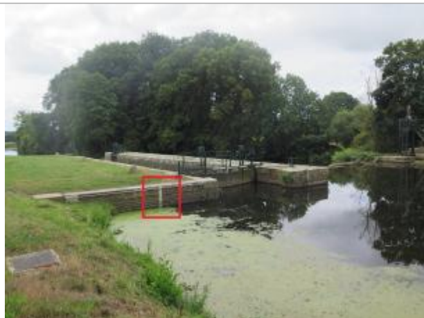
Ecluse de Grenouilliere amont à Bréhan

Coordonnées WGS84 : X: -2.67870822 / Y: 48.01859850