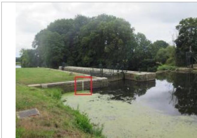
Ecluse de Grenouilliere amont à Bréhan

Coordonnées WGS84 : X: -2.67870822 / Y: 48.01859850