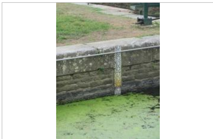
Ecluse de Grenouliere à Bréhan échelle amont