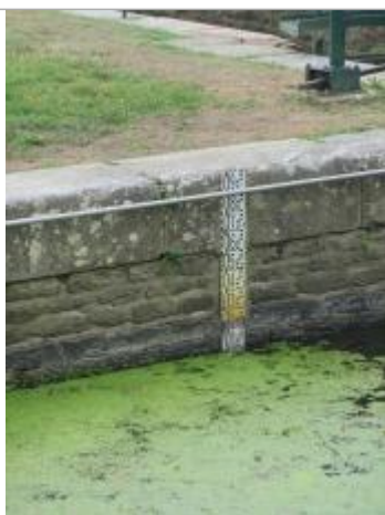
Ecluse de Grenouilliere à Bréhan échelle amont