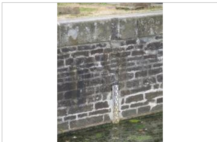
Ecluse de Timadeuc à Bréhan échelle amont