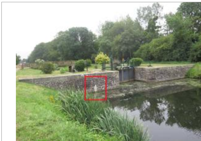
Ecluse de Timadeuc à Bréhan amont

Coordonnées WGS84 : X: -2.72779738 / Y: 48.04860050