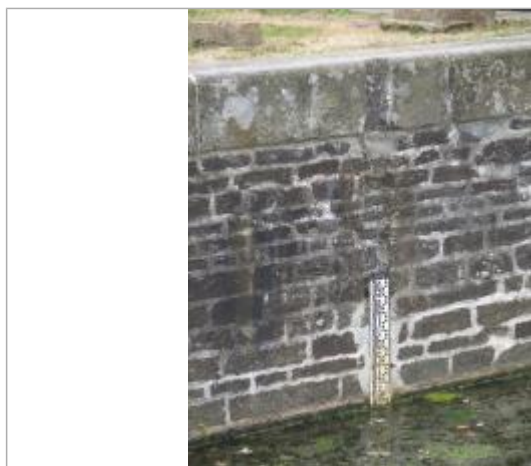
Ecluse de Timadeuc à Bréhan échelle amont