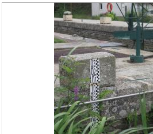
Ecluse de Rohan échelle amont