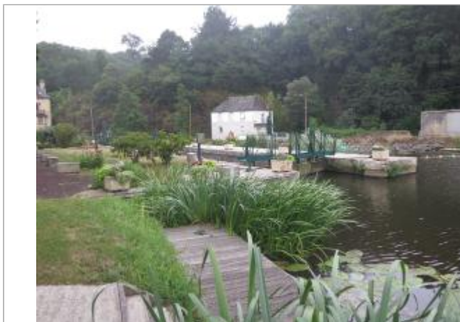
Ecluse de Rohan amont