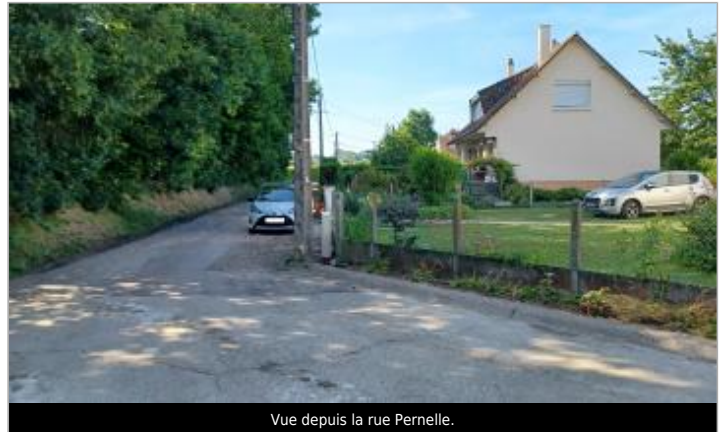
Vue depuis la rue Pernelle.