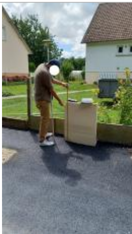
Laisse de crue à 82 cm/sol.

Altitude calculée de l'eau (en m) : 24.2 m