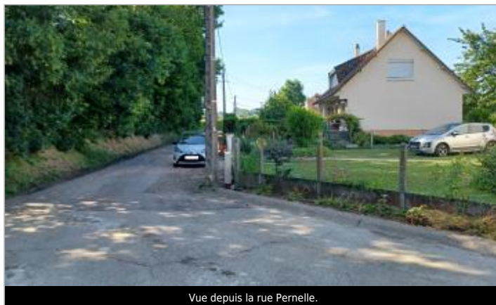
Vue depuis la rue Pernelle.