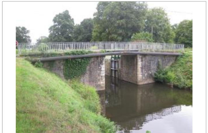
Ecluse de Saint Samson échelle aval (disparue)