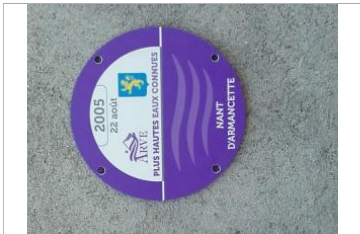
crue de 2005 du nant d'Armançette