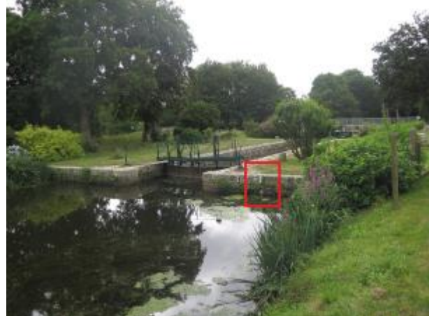
Ecluse de Saint-Samson à Rohan