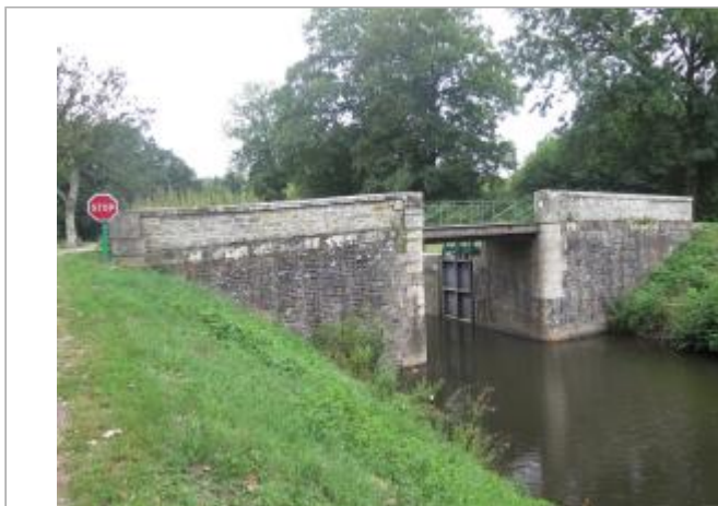
Aval écluse du Guer à Rohan

Coordonnées WGS84 : X: -2.77425687 / Y: 48.08696960