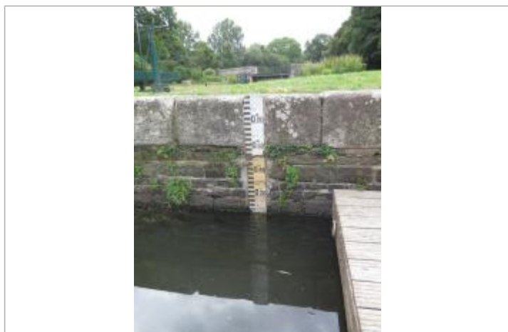
Echelle amont de l'écluse du Guer à Rohan

Altitude calculée de l'eau (en m) : 67.781 m