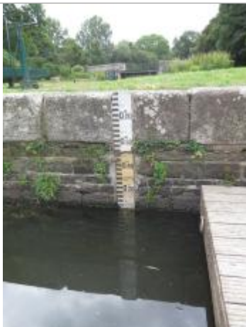
Echelle amont de l'écluse du Guer à Rohan

Altitude calculée de l'eau (en m) : 67.781