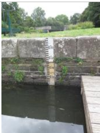
Echelle amont de l'écluse du Guer à Rohan

Altitude calculée de l'eau (en m) : 67.781