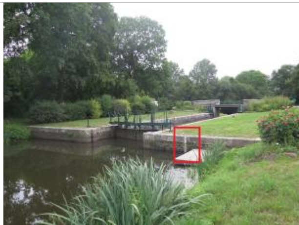
Ecluse du Guer à Rohan