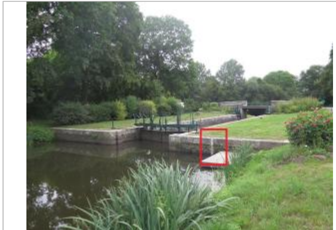
Ecluse du Guer à Rohan

Coordonnées WGS84 : X: -2.77472048 / Y: 48.08711040