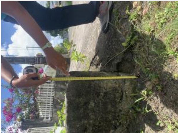
Témoignage de la hauteur d'eau atteinte

Altitude calculée de l'eau (en m) : 1.952