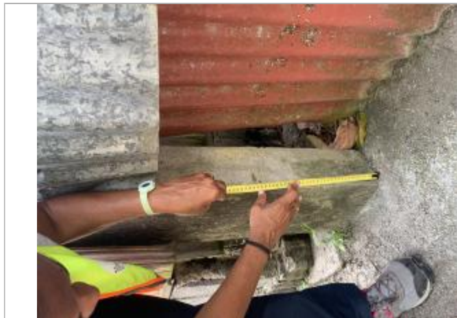
Dépôts matières solides

SOURCE DE REPÉRAGE : CAMPAGNE TERRAIN POST-INONDATION 30/04/22 DEAL GUADELOUPE - 30/04/2022