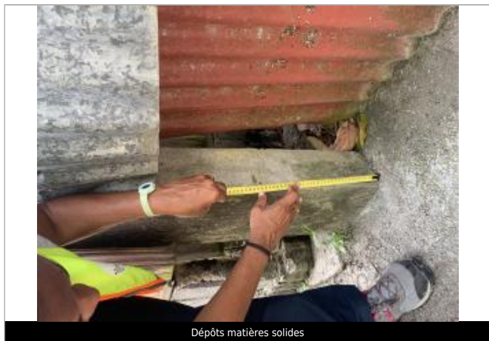
Dépôts matières solides

Altitude calculée de l'eau (en m) : 14.47