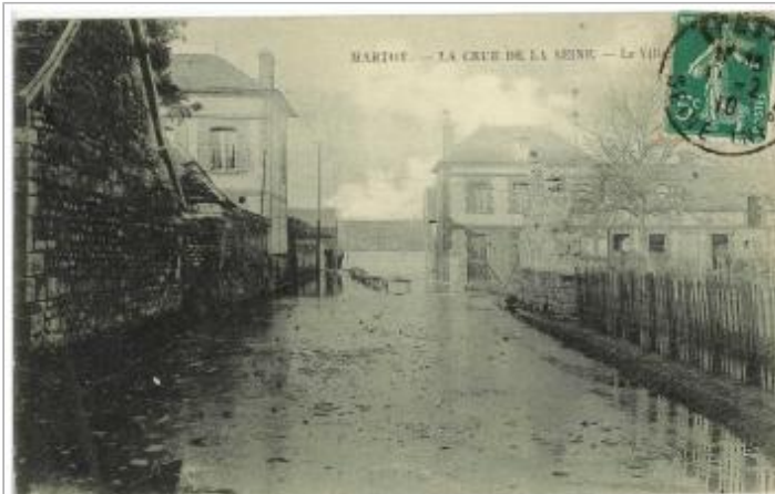
carte postale 1910