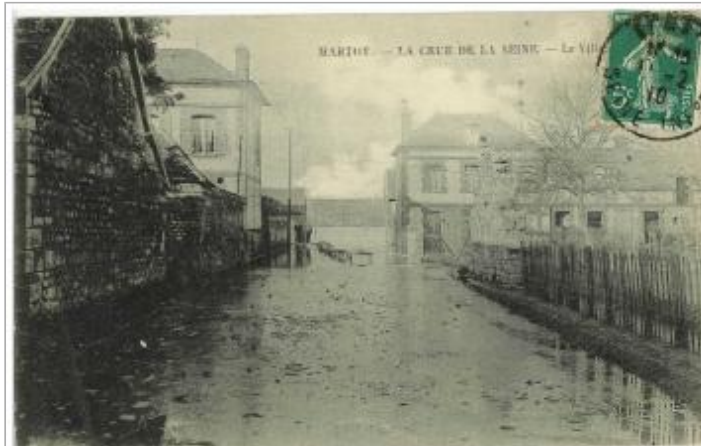
carte postale 1910

Coordonnées WGS84 : X: 1.06448112 / Y: 49.29841140