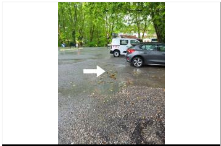
Vue de la laïsse

MARQUE Maximum de l'inondation : Oui État du repère : Disparu