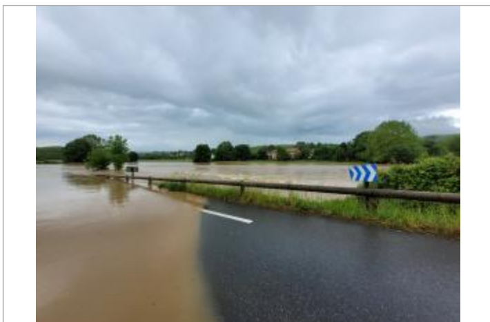
Photo en crue

SOURCE DE REPÉRAGE : CAMPAGNE TERRAIN CAPB À L'OCCASION DE LA CRUE DE LA NIVELLE DU 13/05/2023 - 13/05/2023