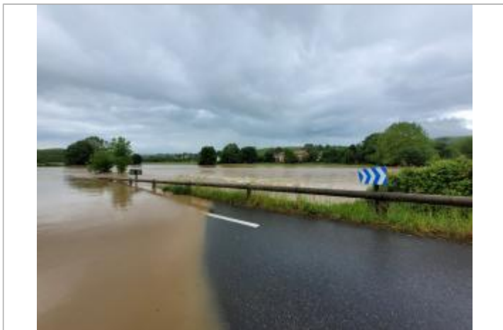
Photo en crue

SOURCE DE REPÉRAGE : CAMPAGNE TERRAIN CAPB À L'OCCASION DE LA CRUE DE LA NIVELLE DU 13/05/2023 - 13/05/2023