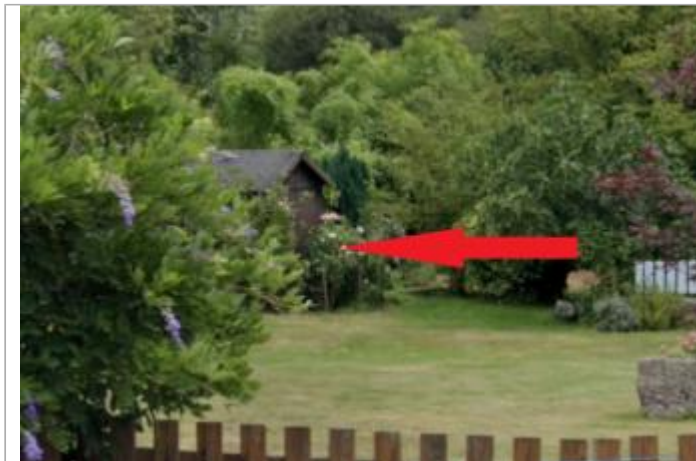
Cabane de jardin au 5 route du Pouldu

Coordonnées WGS84 : X: -3.54391518 / Y: 47.85880100