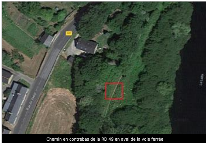
Chemin en contrebas de la RD 49 en aval de la voie ferrée

Coordonnées WGS84 : X: -3.54242479 / Y: 47.86243360