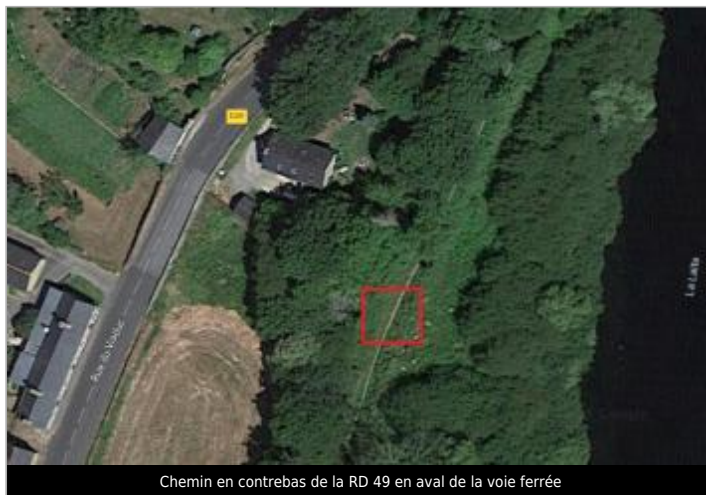
Chemin en contrebas de la RD 49 en aval de la voie ferrée