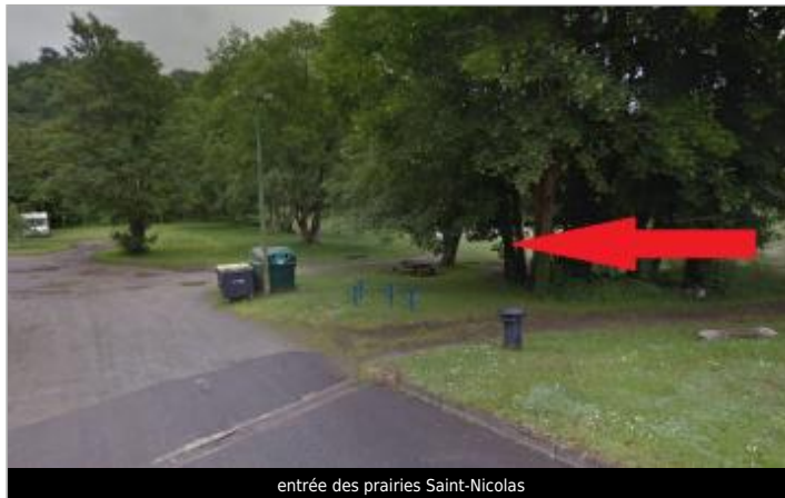
entrée des prairies Saint-Nicolas