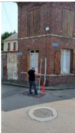
Vue du site depuis le Quai Joffre.

Altitude calculée de l'eau (en m) : 8.83 m