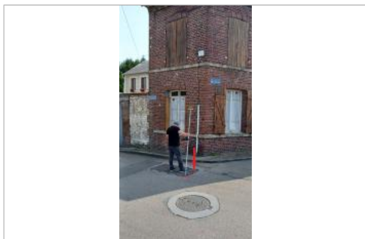
Vue du site depuis le Quai Joffre.

Altitude calculée de l'eau (en m) : 8.83