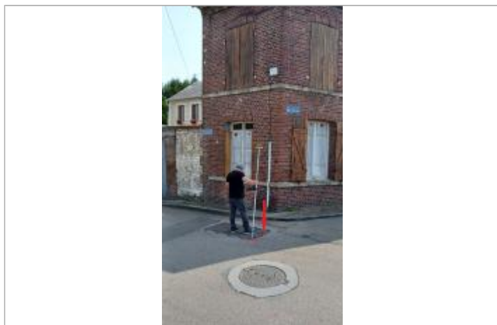
Vue du site depuis le Quai Joffre.

Altitude calculée de l'eau (en m) : 8.83