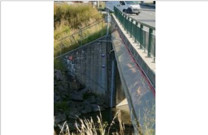
Pont sur le Borne de la route du Grand Bornand