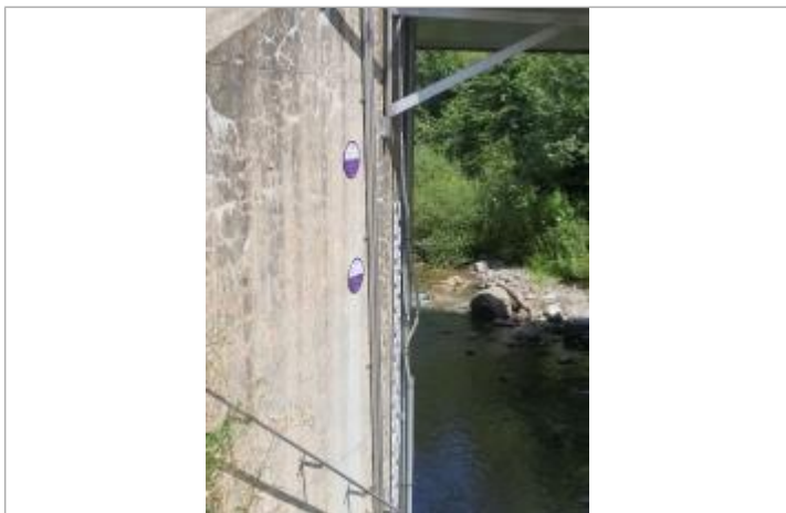
crue du Borne de 1987