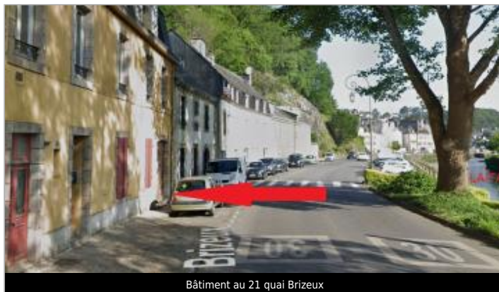
Bâtiment au 21 quai Brizeux