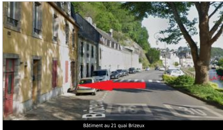
Bâtiment au 21 quai Brizeux

Coordonnées WGS84 : X: -3.54469870 / Y: 47.86857530